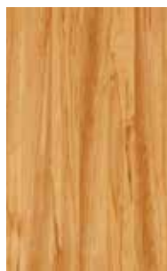
cœur de hêtre