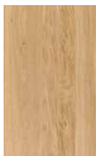
rovere olio bianco