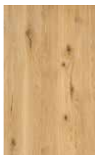
rovere selvatico olio bianco*