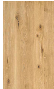
Eiche Wild Weißöl*