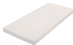
MA10 | MA15

listelli in frassino elastico 7 zone di ammortizzazione e strisce in lattice naturale su 2 livelli