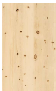
cirmolo (non trattato a olio)**