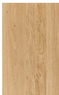
rovere olio bianco