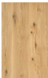
rovere selvatico olio bianco*