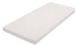
MA10 | MA15

Rimellen aus elastischem Eschenholz 7-fach gefedert auf Naturlatextreifen in 2 Ebenen