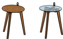
BT HI H5